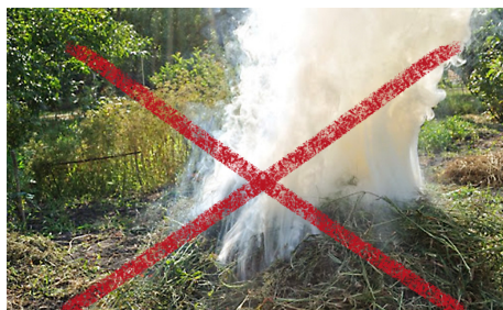
Gestion différenciée et Loi Labbé

Nombre d'actions majeures sont menées sur tous les territoires dans le cadre de la prévention-gestion de proximité des biodéchets (P-GProx) : obligation de proposer des solutions de tri à la source des biodéchets, éco-gestion des espaces verts, désengorgement des déchetteries de leur déchets végétaux... Autant d'actions qu'on ne peut réduire à une simple histoire de gestion de nos poubelles ! Ce sont, en creux, des leviers d'accompagnement des attendus éco-citoyens, de sensibilisation et de responsabilisation des populations, de soins portés à l'environnement et à la biodiversité... Une véritable porte d'entrée à la transition écologique, clé de l'avenir à tourner dans nos serrures dès aujourd'hui.