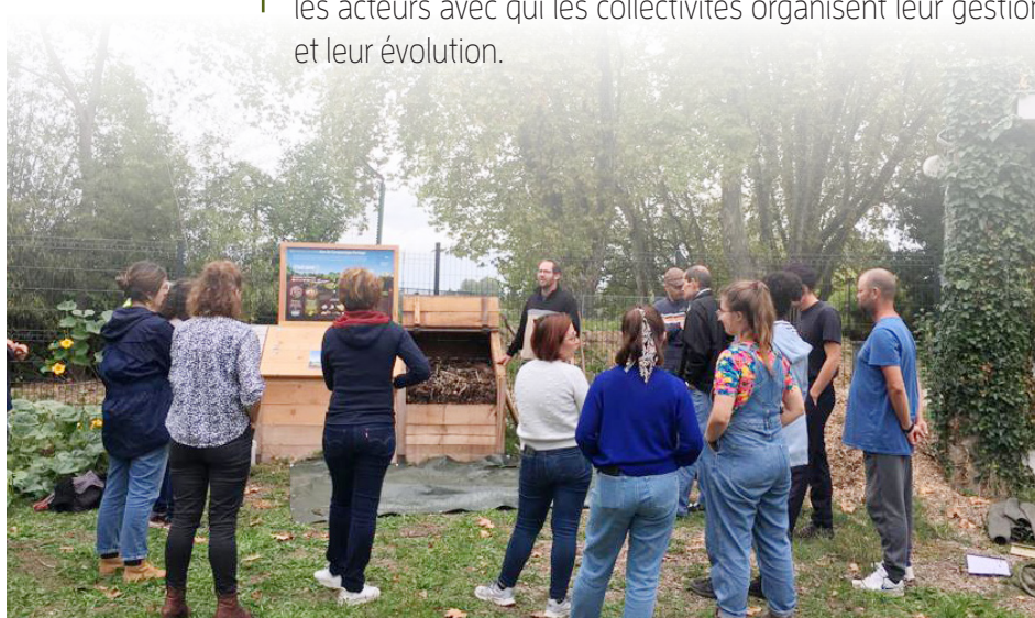
Mobilisation collective citoyenne autour des composteurs

Particulièrement conçue pour éclairer les élus sur leurs décisions et investissements, cette sensibilisation accueille tous les acteurs avec qui les collectivités organisent leur gestion et leur évolution.